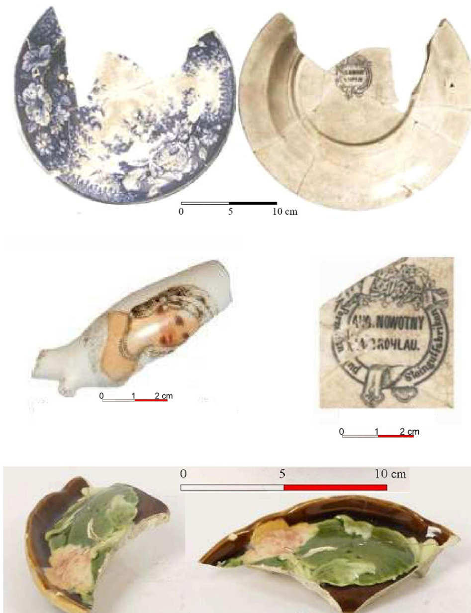
Ryc. 7. Przykłady importowanych wyrobów ceramicznych z terenów Czech, znalezione w Stanisławicach, gm. Bochnia (wg Tabaszewski 2018)