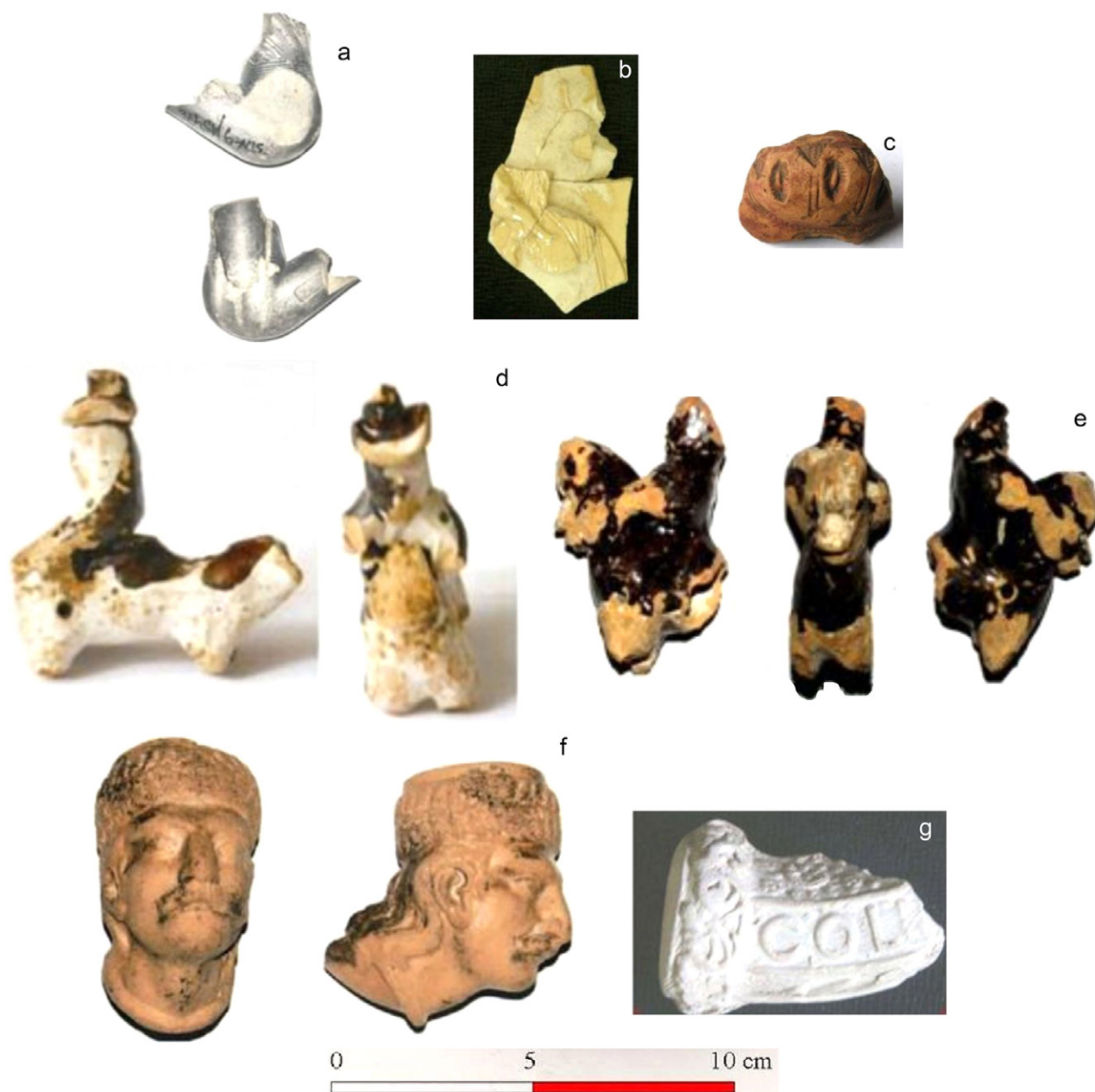
Ryc. 6. Przykłady innych wyrobów garncarskich z terenów Małopolski (a-e), Węgier (f) i Niemiec (g), znalezione w Stanisławicach, gm. Bochnia (a, b, d-f), Alwernia, gm. loco (c) i Brzeszczach-Jawiszowicach, gm. Brzeszcze (e) (wg Tabaszewski 2013c; 2018; 2021)