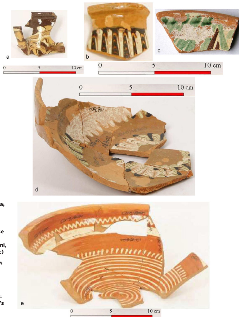
Ryc. 4. Zdobienie naczyń: (a) zdobienie typu flambé; (b, d) zdobienie techniką faldowania; (c) malowanie (ornament roślinny); (e) malowanie (ornament geometryczny), na przykładzie znalezisk ze stanowiska Stanisławice stan. 9, gm. Bochnia (a, b, d, e) (wg Tabaszewski 2018) i rynku w Alwerni, gm. loco (c) (wg Tabaszewski 2013c)