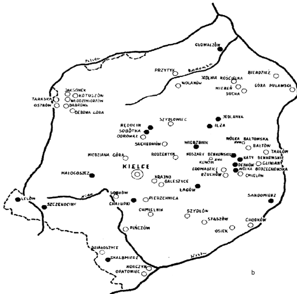
Ryc. 1. Rozmieszczenie warsztatów garncarskich ok. poł. XX w.: (a) woj. małopolskie; (b) woj. świętokrzyskie (wg Głowa 1956)