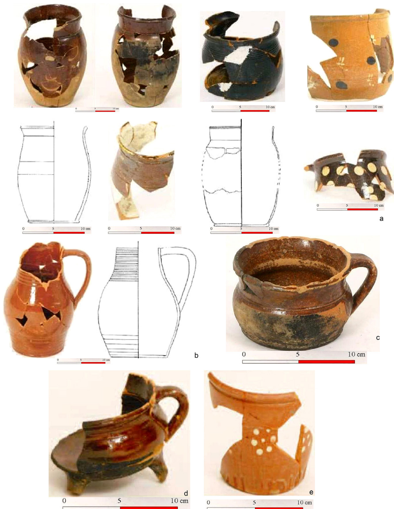
Ryc. 2. Zestaw form naczyń na przykładzie stanowiska Stanisławice stan. 9, gm. Bochnia: (a) garnki; (b) dzbanki; (c) kubek; (d) kubek na trzech nóżkach; (e) doniczka (wg Tabaszewski 2018)